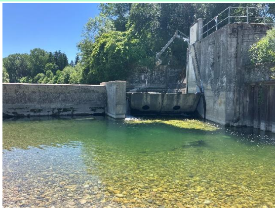
Abbildung 1 Ausleitungswehr für Triebwasserkanal beider KW oberhalb bereits revitalisierter Strecke