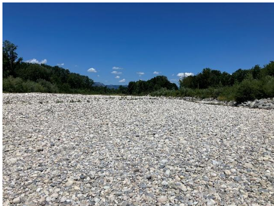
Abbildung 3 Weitgehend trockenfallendes Flussbett in bereits revitalisiertem Abschnitt der Emme auf Höhe KWH