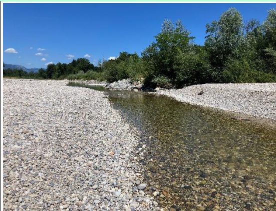
Abbildung 2 Reduzierte Wasserführung in der Emme